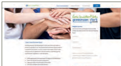
So sieht die Startseite des GeschwisterNetzes aus.

S ie sind unter besonderen Bedingungen groß geworden und fühlen sich als Erwachsene oft für ihren Bruder oder ihre Schwester verantwortlich: erwachsene Geschwister von Menschen mit Behinderung. GeschwisterNetz ist ein neues Online-Angebot der Bundesvereinigung Lebenshilfe. Es soll erwachsene Geschwister von Menschen mit Behinderung verbinden, unterstützen und stärken.