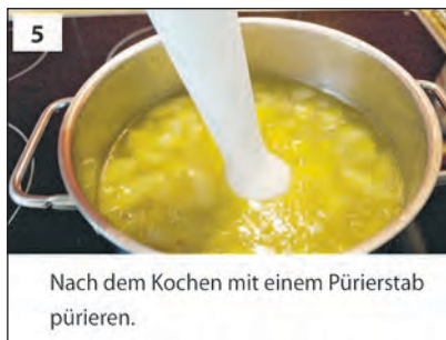
Nach dem Kochen mit einem Pürierstab pürieren.

Aus: Kochwerkstatt des Familienunterstützenden Dienstes der Lebenshilfe Heinsberg in Leichter Sprache