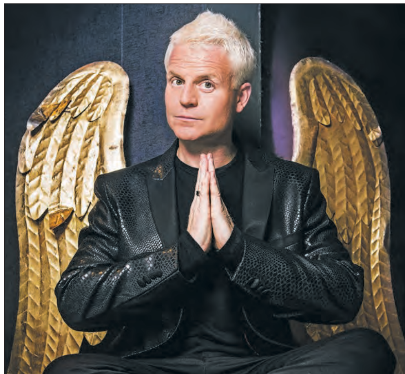
Guido Cantz sanft wie ein Engel: Neue Comedytour „Blondiläum – 25 Jahre Best of Guido Cantz“ startet ab 30. September.