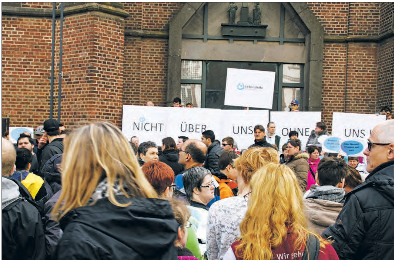
Flashmob der Lebenshilfe Rhein-Kreis Neuss auf dem Grevenbroicher Marktplatz.

Flashmob der Lebenshilfe Rhein-Kreis Neuss e.V. und anderer Lebenshilfen